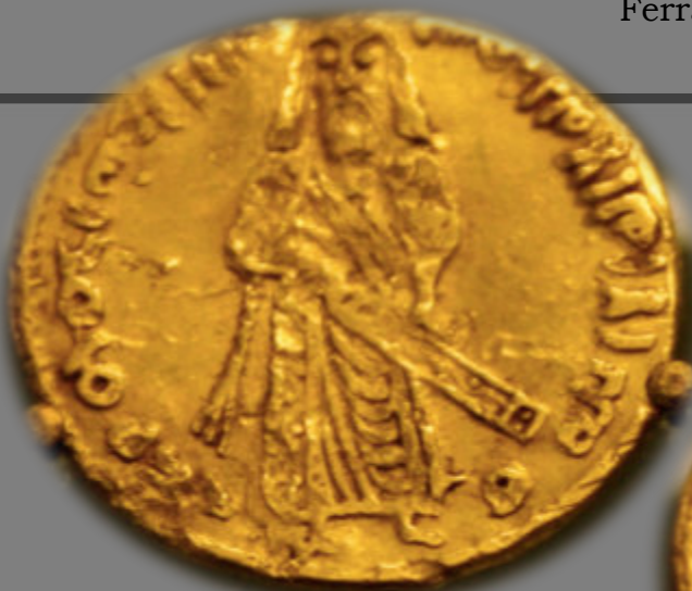
Dinar de oro de Abd-al-Malik, conservado en el British Museum.