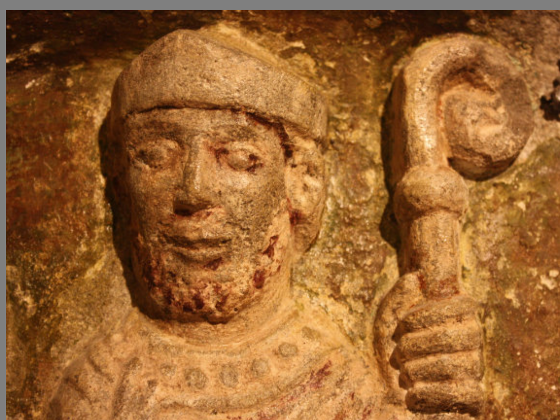
Imagen de san Ramón procedente de uno de los laterales de su sarcófago, hoy reconvertido en altar, c. 1170

Los prelados Raimundo Dalmacio (1076-1094) y san Ramón (1114-1126) fueron quienes culminaron la obra de la catedral