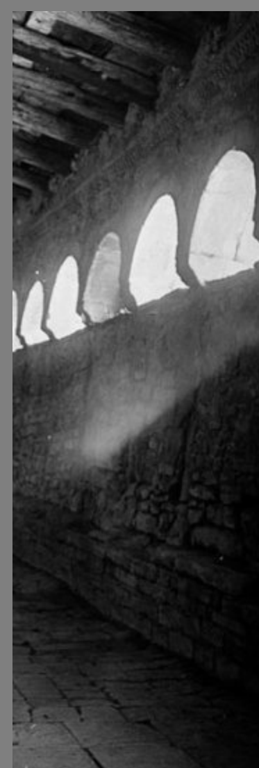
Fotografías antiguas de principios del siglo XX del claustro de Roda de Isábena, procedentes de los archivos de José Miguel Oltra y de Ricardo del Arco de la Fototeca de la Diputación de Huesca