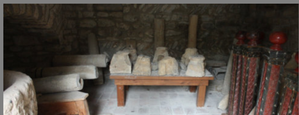
Parte del lapidario disperso de Roda de Isábena