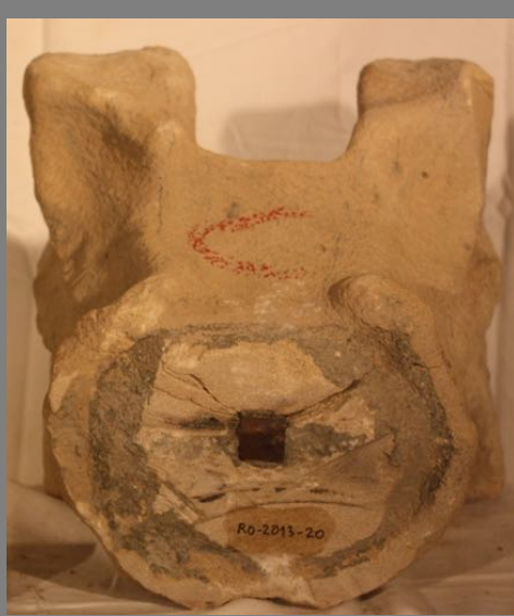
Uno de los capiteles del lapidario de la catedral [RO-2013-20]

El mayor número de piezas lo constituyen capiteles, fustes y basas que proceden del claustro. Hoy son fragmentos descontextualizados que responden a las sucesivas restauraciones, restituciones y remodelaciones del recinto claustral