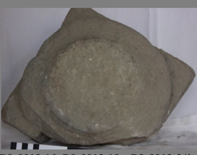
Basas procedentes del lapidario de la catedral [RO-2013-16, RO-2013-18 y RO-2013-34]