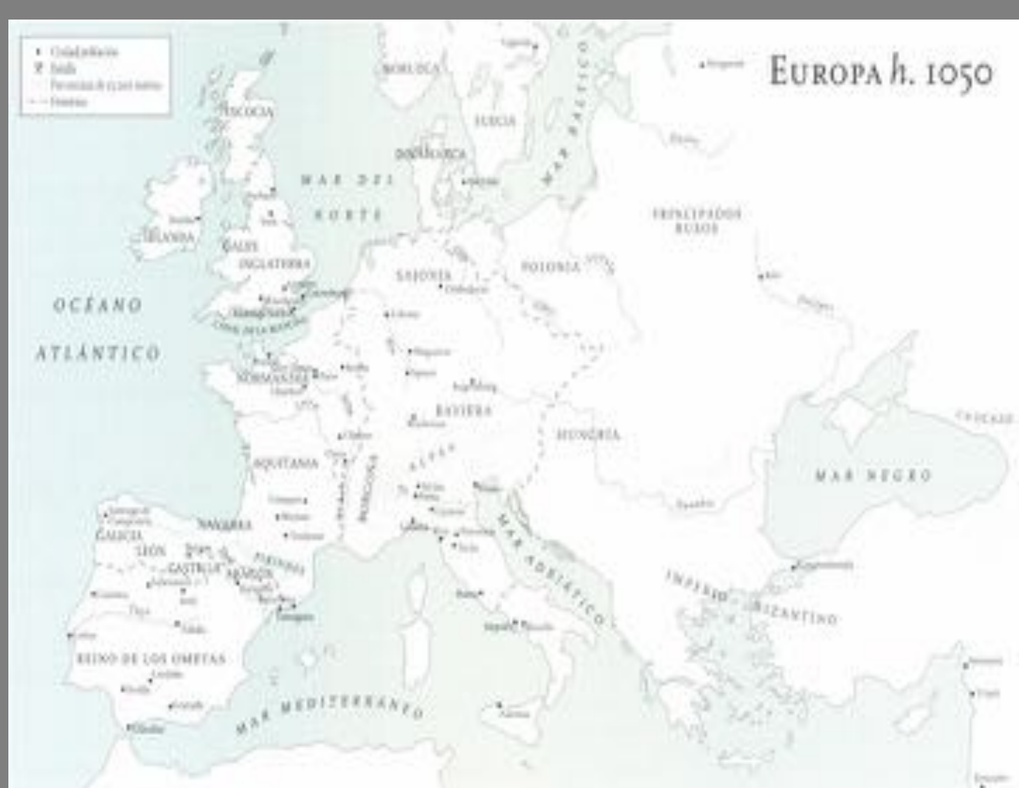
Europa hacia 1050. Extraído de Robert Bartlett, Panorama Medieval , 2002

El románico, que ha sido considerado como el primer estilo artístico internacional , se desarrolló desde finales del siglo X hasta el XIII fundamentalmente en el continente europeo