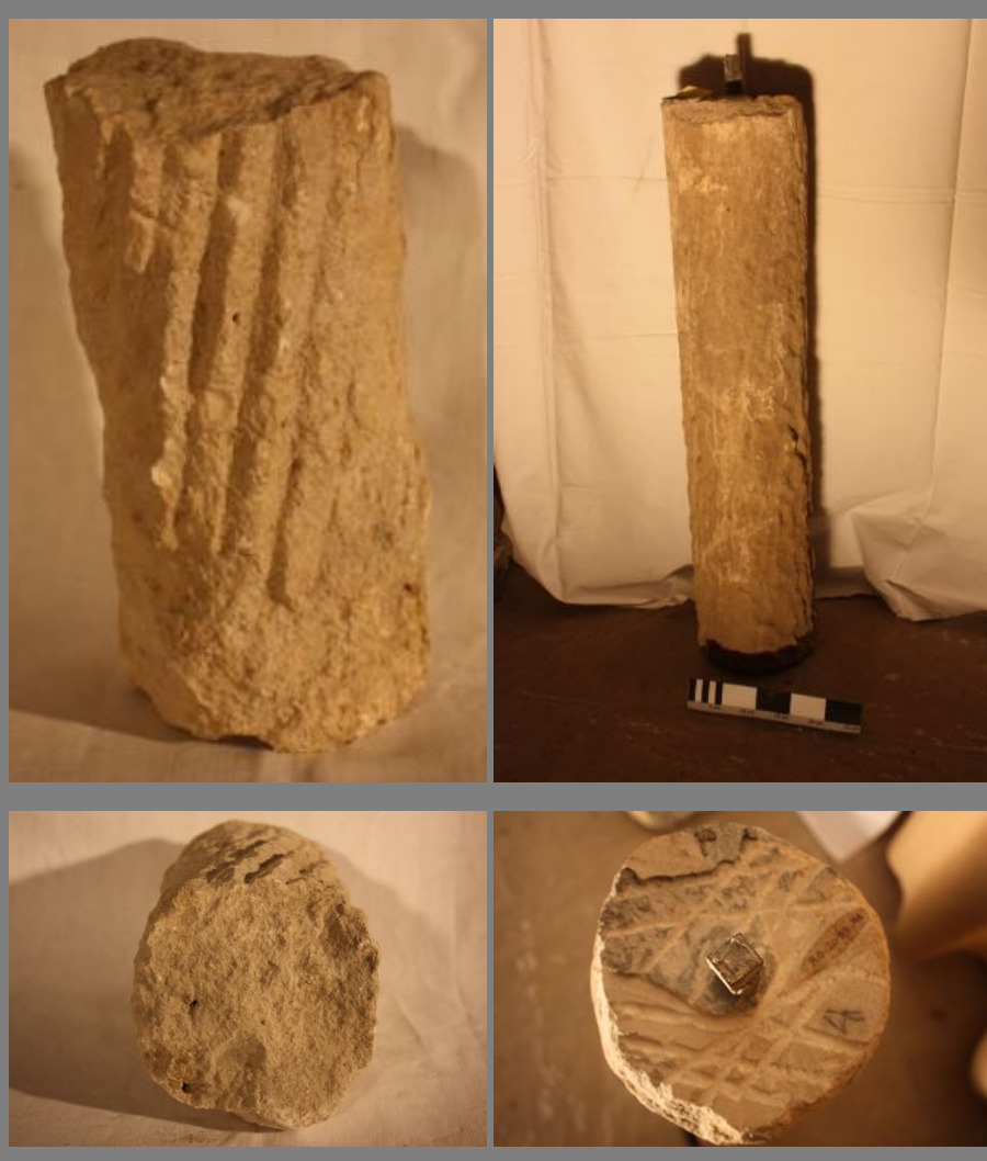
Fustes del lapidario de la catedral [RO-2013-5 y RO-2013-41]. Panorámica de los fustes del claustro

En general, sus diámetros oscilan entre los 14 cm. y 18 cm. Algunos presentan numeración pintada, lo que demuestra su clasificación y ulterior restitución en alguna de las campañas de restauración llevadas a cabo a partir de 1931