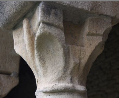
Capitel del claustro de la catedral de Roda de isábena

El mayor número de piezas lo constituyen capiteles, fustes y basas que proceden del claustro. Hoy son fragmentos descontextualizados que responden a las sucesivas restauraciones, restituciones y remodelaciones del recinto claustral